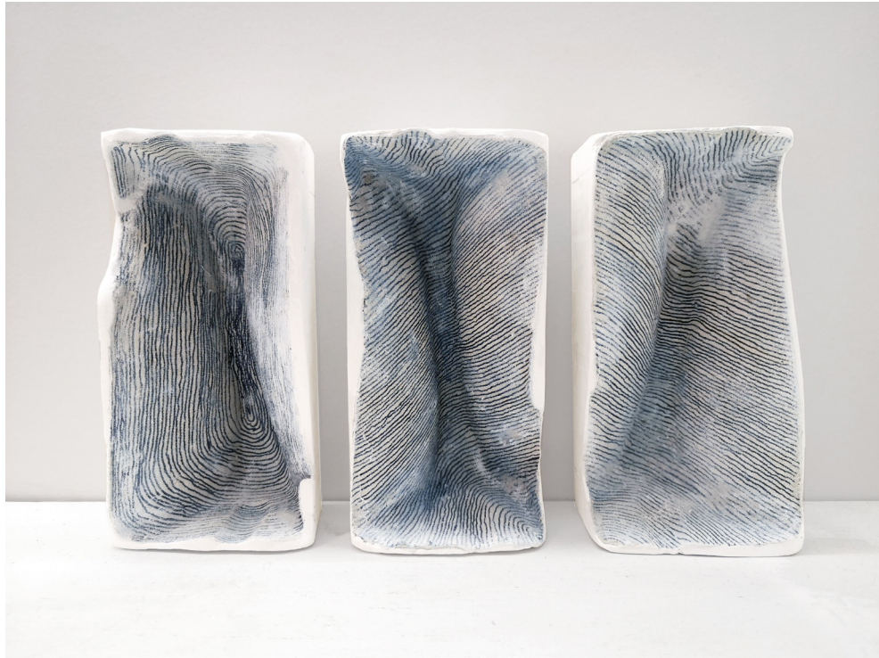
Alice Brun-Ney Triptyque, La sagesse , 2022 Plâtre, carton et encre 13,5 × 22,5 × 4,5 × cm