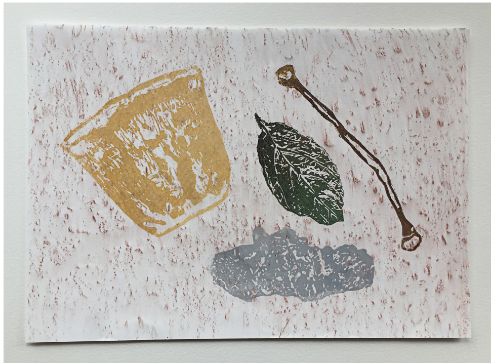
Morgane Porcheron «Novembre/décembre 2021 #1» , 2022 Linogravure, frottage, encre et crayon de couleur 31,7 x 23 x 3 cm