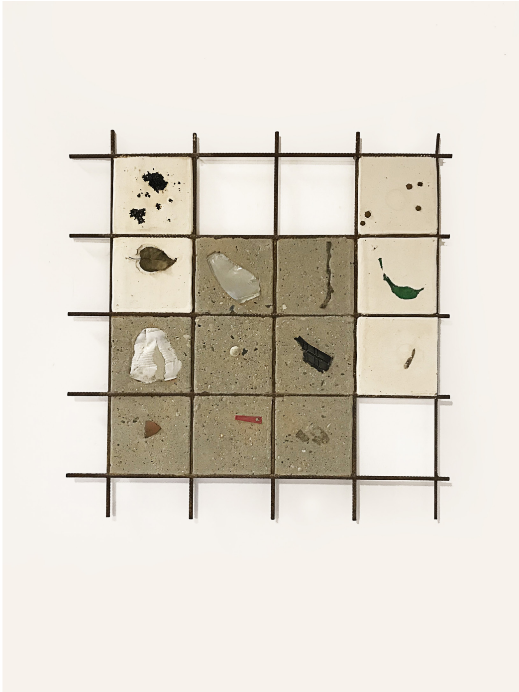
Morgane Porcheron Damier de trouvailles #3, 2023 Plâtre, béton, treillis métallique, éléments divers récupérés 70,5 x 71,4 x 2,5 cm