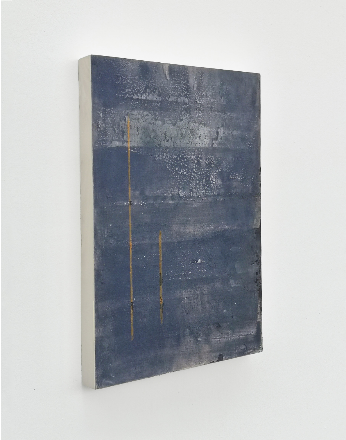
Alice Brun-Ney Einziger zug I , 2026 Plâtre, papier, terre, pigments et crayon 29,5 × 21,2 × 2,2 cm