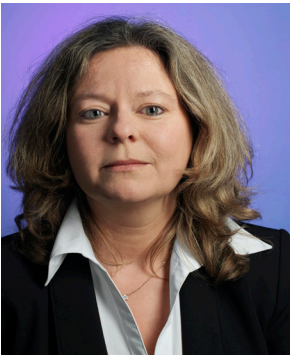
Christophe Beauregard Série Le Meilleur des Mondes , 2012 Anne-Marie C-Print 100 x 75 cm édition de 3 - 3000 € 40 x 48,5 cm édition de 5 - 1800 €