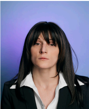
Christophe Beauregard Série Le Meilleur des Mondes , 2012 Céline C-Print 100 x 75 cm édition de 3 - 3000 € 40 x 48,5 cm édition de 5 - 1800 €