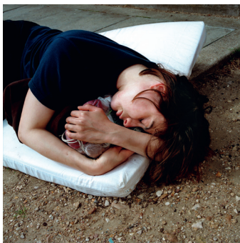
Christophe Beauregard Série Semantic Tramps 10 , 2007 C-Print 90 x 90 cm édition de 3 - 3000 € 50 x 50 cm édition de 5 - 1800 €