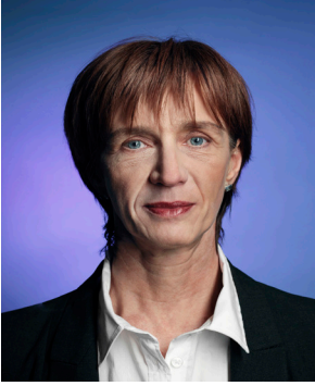
Christophe Beauregard Série Le Meilleur des Mondes , 2012 Angela C-Print 100 x 75 cm édition de 3 - 3000 € 40 x 48,5 cm édition de 5 - 1800 €