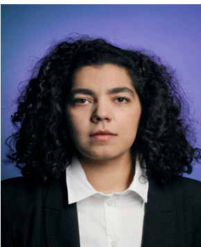
Christophe Beauregard Série Le Meilleur des Mondes , 2012 Cemile C-Print 100 x 75 cm édition de 3 - 3000 € 40 x 48,5 cm édition de 5 - 1800 €