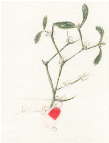
Elise Bergamini Le gui , 2018 crayons de couleurs sur papier bouffant 15 x 21 cm 300 €