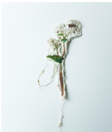
Elise Bergamini Fleur de blé noir , 2022 pièce de satin brodée, propolis et patine des abeilles 6 x 18 cm 250 €