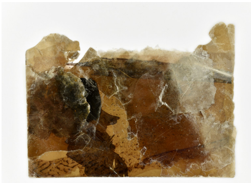
Laurence Nicola sans-titre 2, 2022 Transfert photographique sur mica 20 x 15 cm 600 €