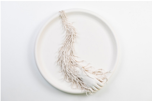
Julia Morlot Camée bras 1 , 2020 Faïence, moulage et modelage, 44 cm 1500 €