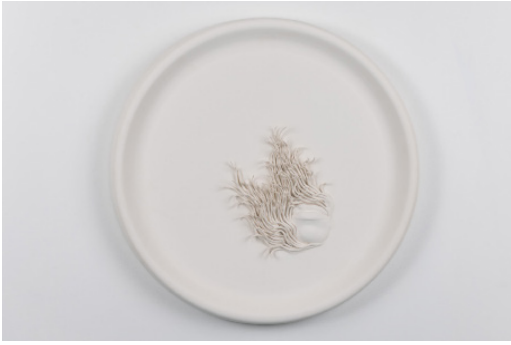
Julia Morlot Camée lèvres 2 , 2021 Faïence, moulage et modelage, 44 cm 1500 €