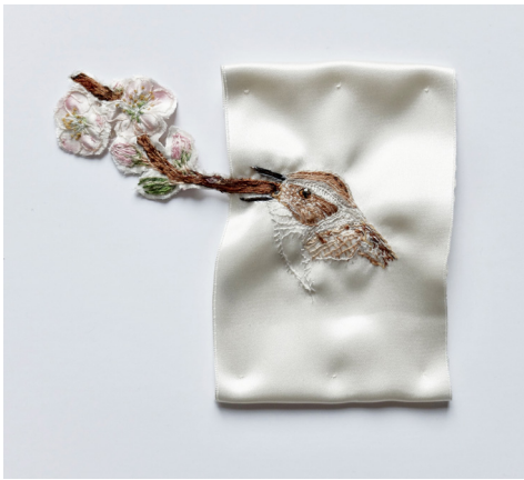
Elise Bergamini Le chant de l'accenteur mouchet , 2022 Pièce de satin brodée et découpée, rehaussée à l'aquarelle et pigment 42 x 42 cm 600 €