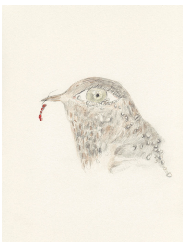
Elise Bergamini Merlette , 2018 crayons de couleurs sur papier bouffant 15 x 21 cm 300 €