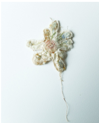
Elise Bergamini Tétin , 2022 pièce de satin brodée, propolis et patine des abeilles 9 x 9,5 cm 150 €