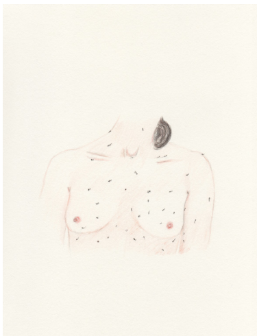
Elise Bergamini Fourmille , 2018 Crayons de couleurs sur papier bouffant 15 x 21 cm 300 €