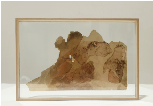
Laurence Nicola, sans-titre 1, 2022 Transfert photographique sur mica 30 x 20 cm 800 €