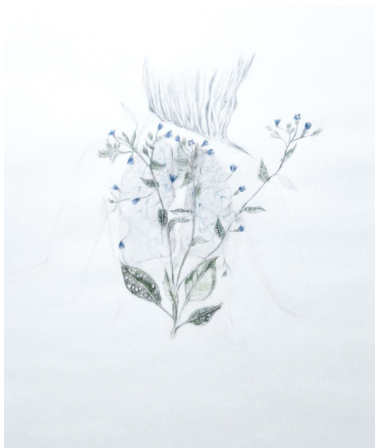
Elise Bergamini Pulmonaria officinalis , 2021, dessin techniques mixtes, crayons de couleurs et mines graphites, rehausse huile de carthame et teinture végétale 49,5 x 70 cm 700 €