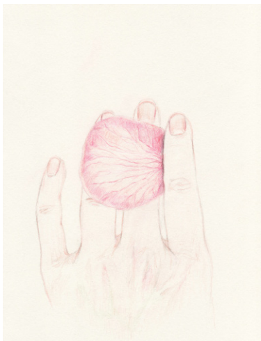
Elise Bergamini Printemps - Pétale , 2018 crayons de couleurs sur papier bouffant 15 x 21 cm 300 €