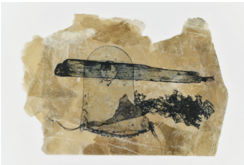
Laurence Nicola Série Mémoire fossile # 1 , 2022 Transfert photographique sur mica 35 x 24 cm 2200 €

* producteur des produits pour la marque «Le grenier Vermont»