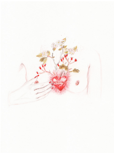
Elise Bergamini Aubépine de mon cœur , 2022 Mines graphites et crayons de couleurs sur papier Leuchtturm 22 x 31 cm 400 €