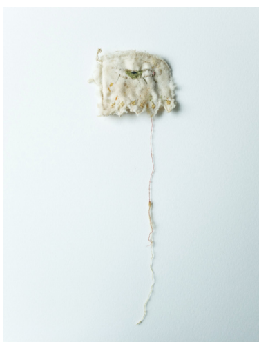
Elise Bergamini Larmes de pollen , 2022 pièce de satin brodée, cheveux, propolis et patine des abeilles 6 x 7 cm 150 €