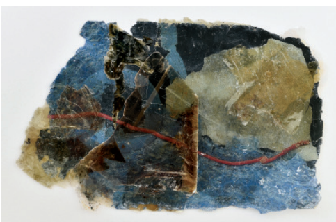
Laurence Nicola Série Mémoire fossile # 4 , 2022 Transfert photographique sur mica 31 x 20 cm 1800 €