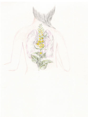
Elise Bergamini Du bouillon blanc , 2020 Mines graphites et crayons de couleurs sur papier Leuchtturm 22 x 31 cm 400 €