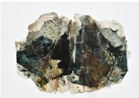
Laurence Nicola Série Mémoire fossile # 2 , 2022 Transfert photographique sur mica 31 x 22 cm 1800 €