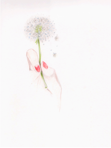
Elise Bergamini Pissenlit , 2020 Mines graphites et crayons de couleurs sur papier Leuchtturm 22 x 31 cm 400 €