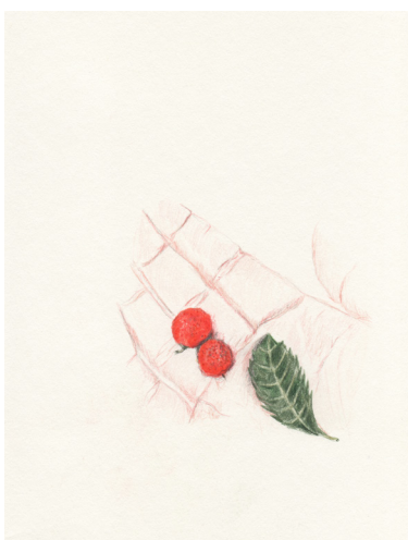
Elise Bergamini Cueillette , 2018 Crayons de couleurs sur papier bouffant 15 x 21 cm 300 €