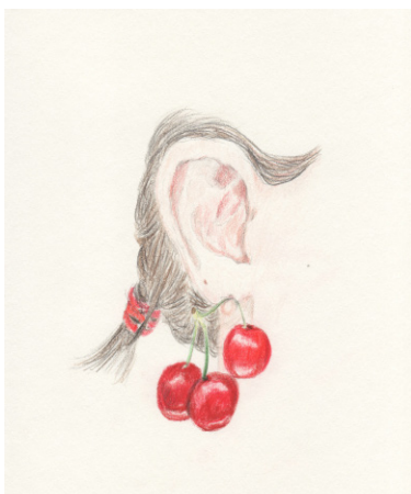
Elise Bergamini Été - Le temps des cerises , 2018 crayons de couleurs sur papier bouffant 15 x 21 cm 300 €