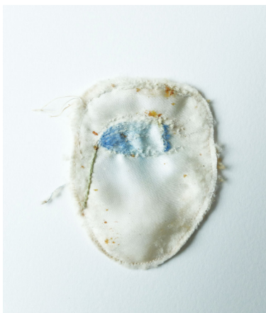
Elise Bergamini Oeil fleur , 2022 pièce de satin brodée, aquarelle, propolis et patine des abeilles 7,5 x 9,5, cm 150 €