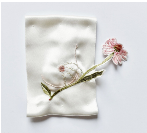
Elise Bergamini Echinacea , 2022 Pièce de satin brodée et découpée, rehaussée à l'aquarelle et pigment 33 x 33 cm 500 €