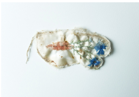
Elise Bergamini Bouche aux bleuets , 2022 pièce de satin brodée, propolis et patine des abeilles 6,5 x 13 cm 300 €