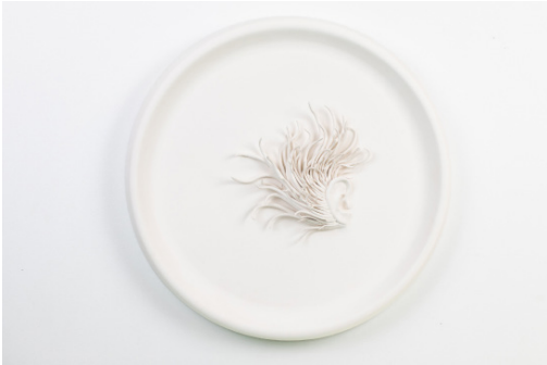
Julia Morlot Camée oreille 2 , 2021 Faïence, moulage et modelage, 44 cm 1500 €