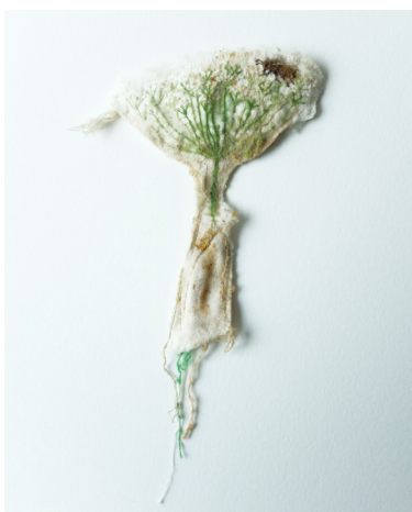
Elise Bergamini Doigt à l'ombelle , 2022 pièce de satin brodée, aquarelle, propolis et patine des abeilles 9 x 13 cm 200 €